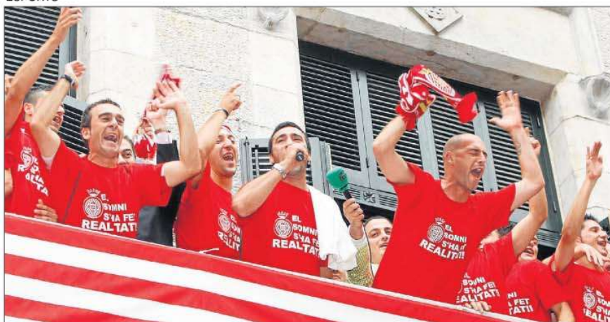
CELEBRACIÓ. La plantilla del Girona FC va anar ahir a l'Ajuntament per oferir a la ciutat l'ascens a Segona A.